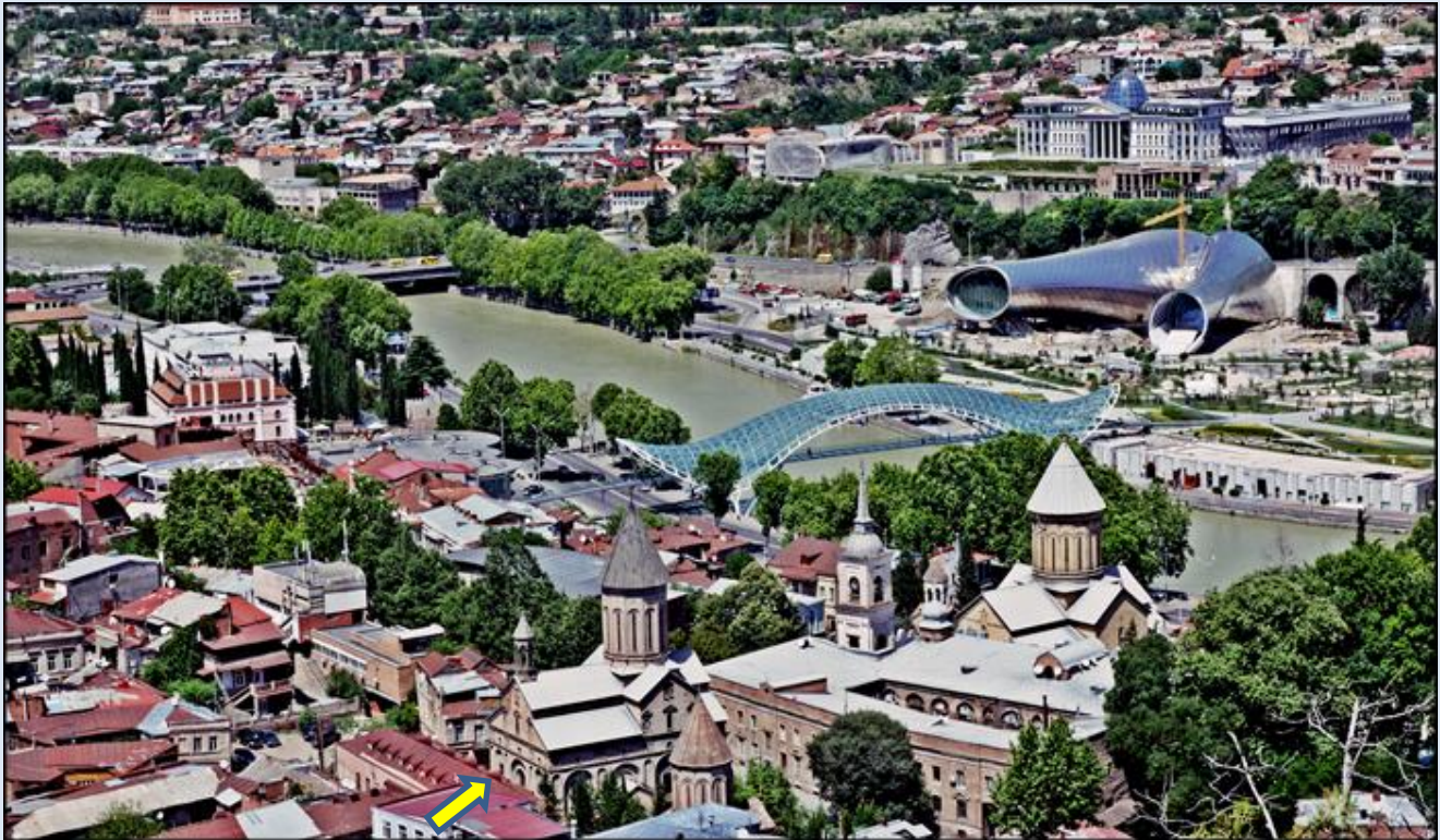
Stare miasto w Tbilisi z katedrą Sioni, Mostem Pokoju, Kościołem Jvaris Mama i rzeką Kura. Na zdjęciu jest też ten kościół Świętej Matki Bożej z Betlejem