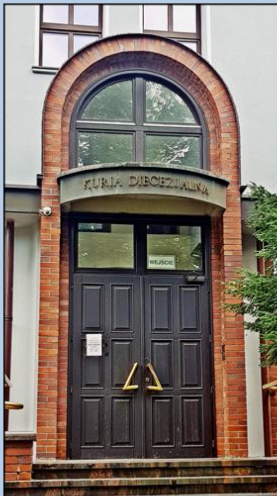
Znajdująca się obok kościoła Kuria Diecezji Gliwickiej za czasów tzw. komuny mieściła Studium Wojskowe dla studentów Politechniki Śląskiej