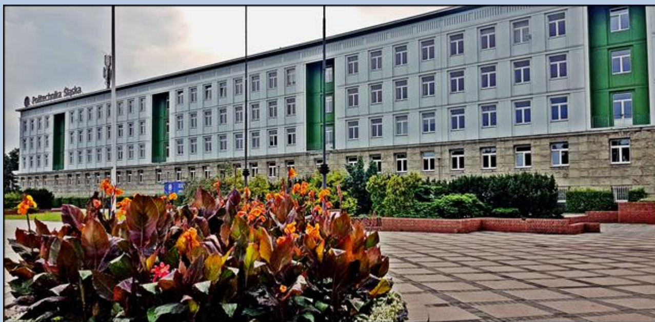
Budynek Wydziału Górniczego Politechniki Śląskiej, za którym znajduje się Kościół pw. św. Alberta Wielkiego