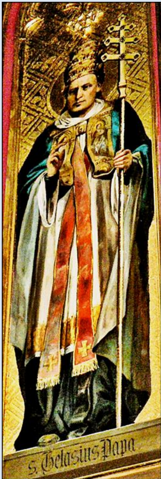
Kraków, obraz w Kościele św. Katarzyny

Z czytania brewiarzowego na dzień 21 listopada