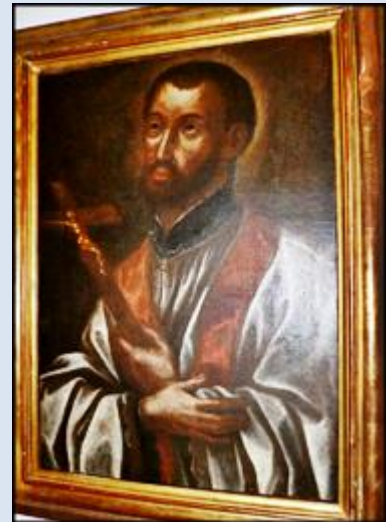
13. Piotrków Trybunalski, fg w ko św. Franciszka Ksawerego; 14. Piotrków Trybunalski, ob. w ko św. Franciszka Ksawerego; 15. Krasnystaw, LBL, ob. z XVIII w. w Muzeum Regionalnym;