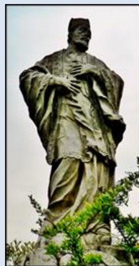
F8,19- Gdańsk- Oliwa, fg w baz. Św. Trójcy; F8,20- Gdańsk- Oliwa, fg2 w baz. Św. Trójcy; F8,21- Legnica, fg przydrożna k. ko św. Jacka;