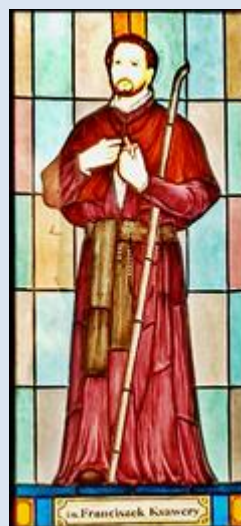
F8,22- Legnica, fg przydrożna w skansenie; Gliwice, ko. MB Kochawińskiej (zdz. pw)

Jeżeli nie zaznaczono inaczej, to zdjęcia: Jan Nitecki