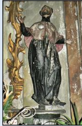
10. Kraków, fg w ko śś. Ap. Piotra i Pawła; 11. Sosnowiec, wt w baz. WNMP; 12. Męcina, MAŁ, fg w ko św. Antoniego;