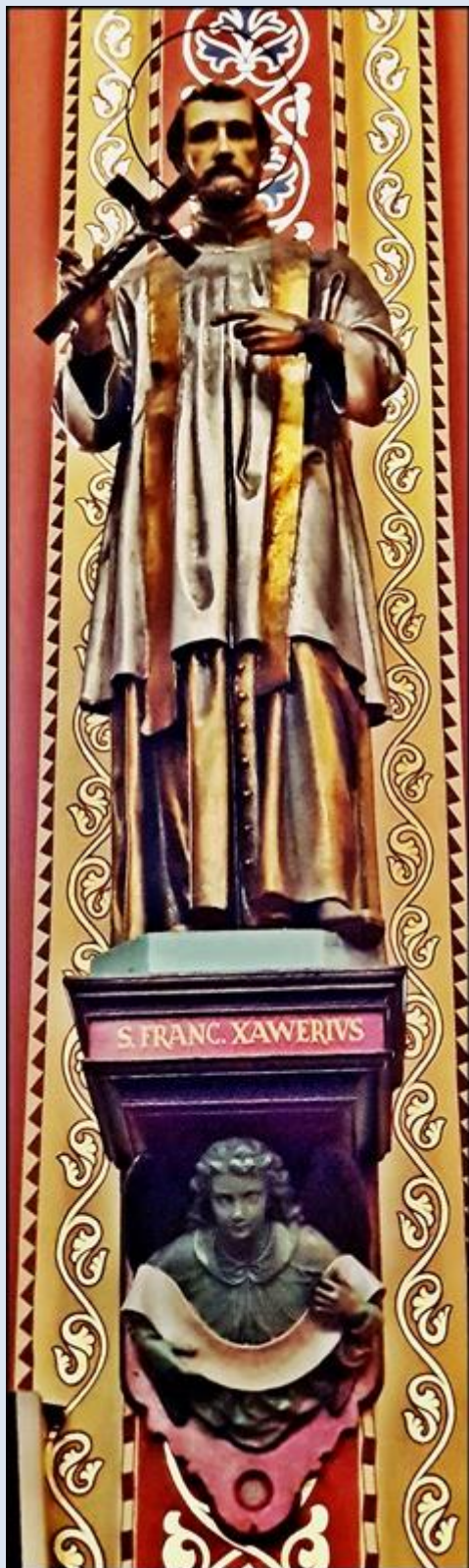
Bytom, Kościół pw. Trójcy Świętej (zdj. tsw)