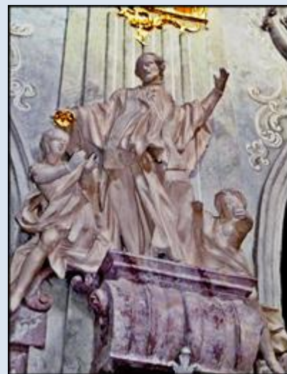
16. Gran Canaria – Las Palmas, fg w kt św. Anny; F8,17- Bystrzyca Kłodzka, fg na Kolumnie Św. Trójcy; F8,18- Głogówek, fg w ko św. Bartłomieja;