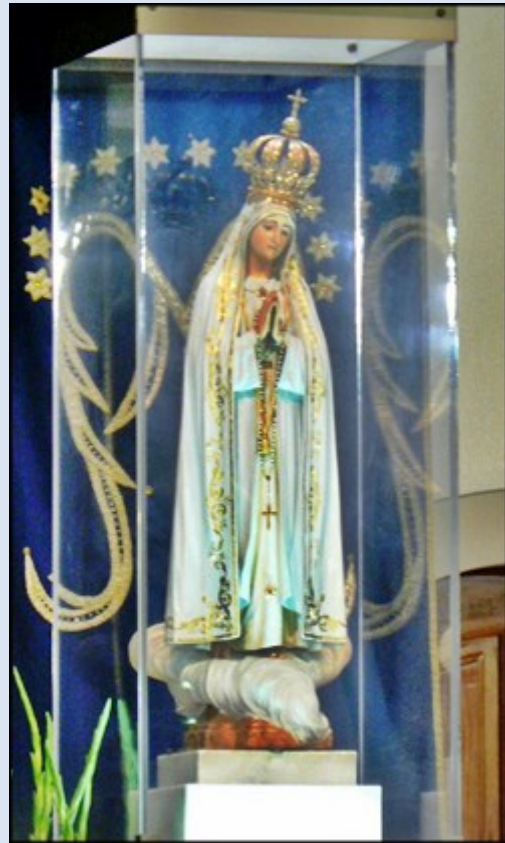
Figura MB Fatimskiej w Bazylice – Figura MB w kaplicy Jej poświęconej