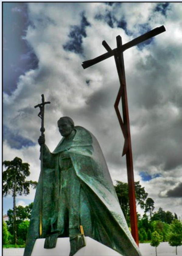
Szopka Narodzenia – Krzyż i pomnik Jana Pawła II