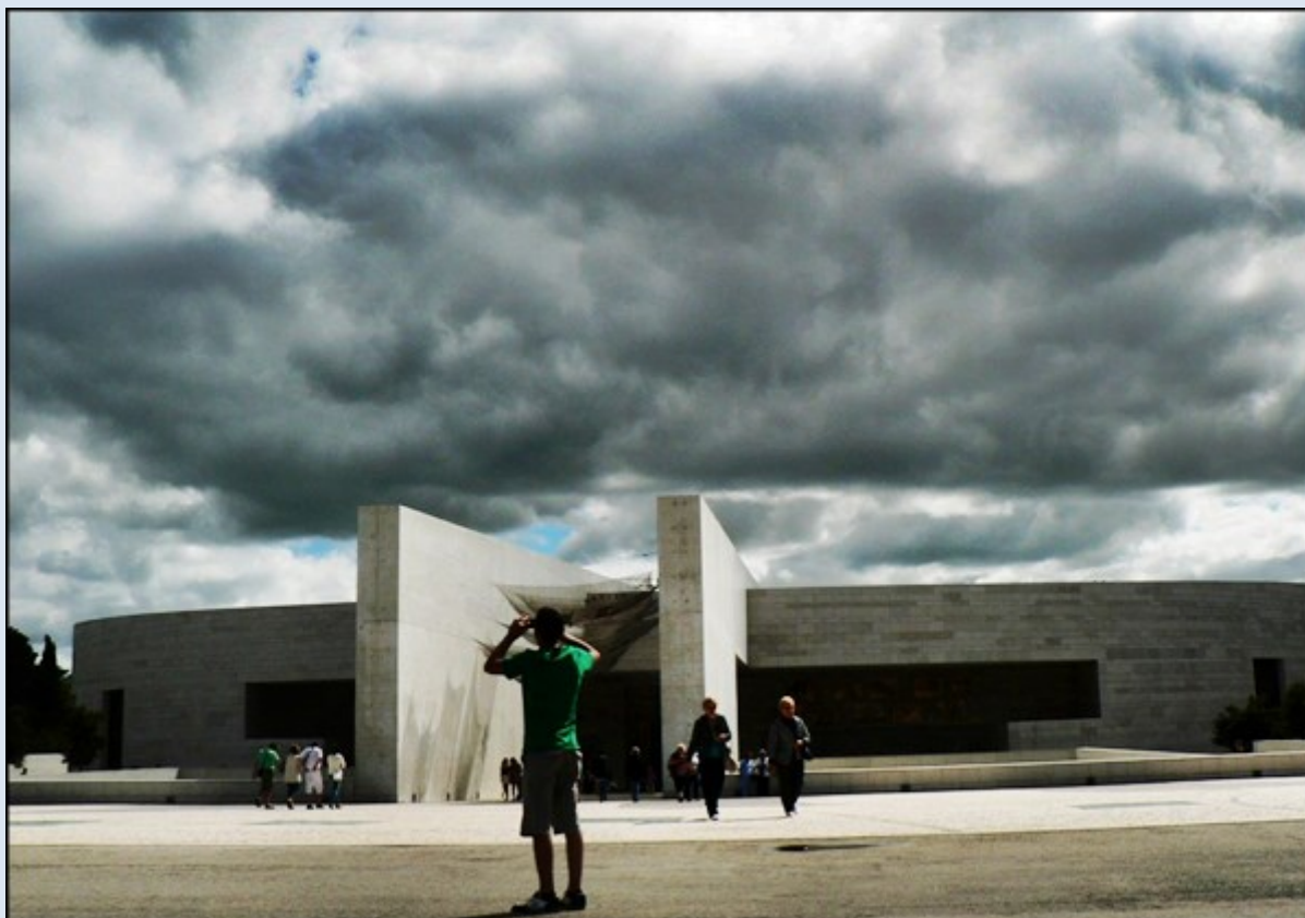
Kościół Trójcy Przenajświętszej