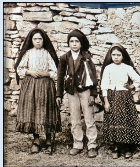
Dom Franciszka i Hiacynty Marto – Świadkowie objawień