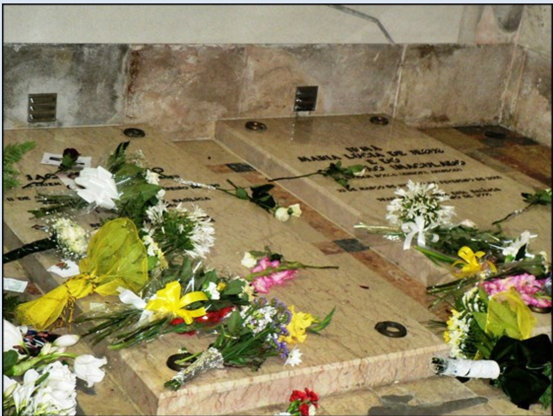
Groby Hiacynty i Łucji