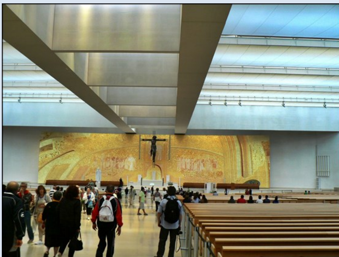
Wnętrze kościoła Trójcy Przenajświętszej