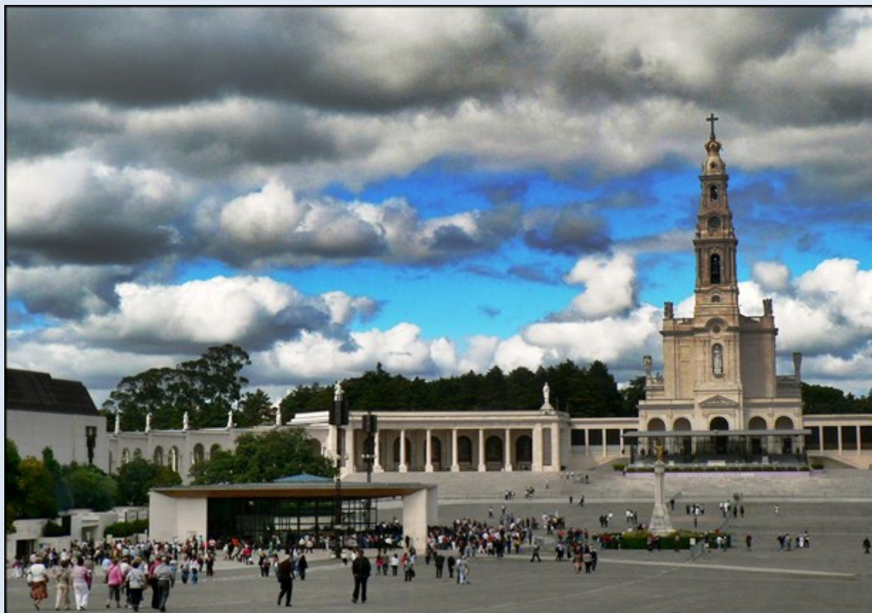
Plac Sanktuarium przed Bazyliką MB Różańcowej