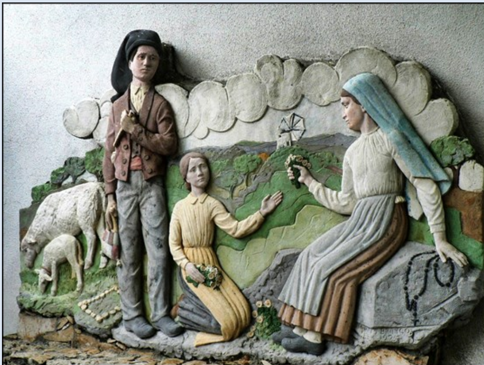
Scena z objawienia