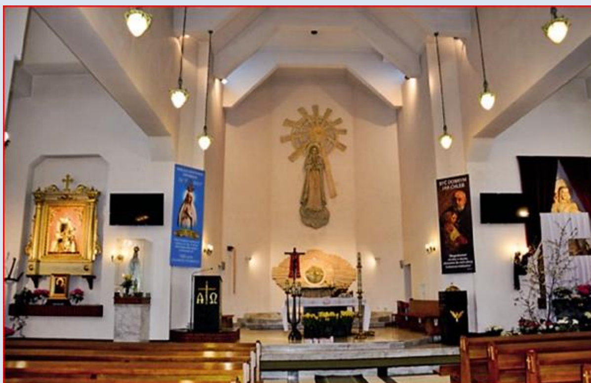
Kościół pw. MB Fatimskiej w Dyminach, dokąd przeniesiono obrazy z Kaplicy MB Częstochowskiej: