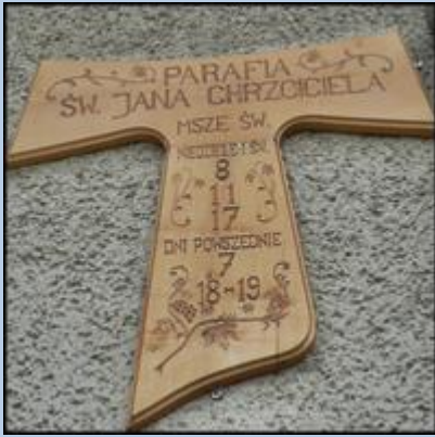
Durszyn (Woj. Małopolskie)