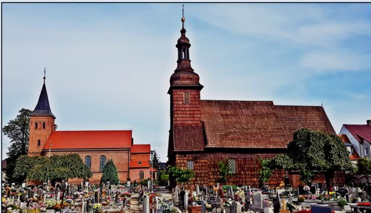
z lewej za cmentarzem i ulicą: ko. Nawiedzenia NMO, z prawej (drewniany na cmentarzu): ko. św. Walentego