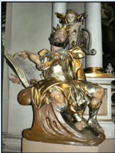
12. Kraków, fg w baz. śś. Michała Arch. i Stanisława;