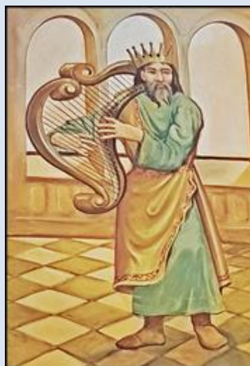
Bytom, ko. św. Jacka (zdj. pw) Zabrze-Rokitnica, ko. NSPJ (zdj. pw) Żędowice, ko. św. Katarzyny Aleksandryjskiej (zdj. pw)