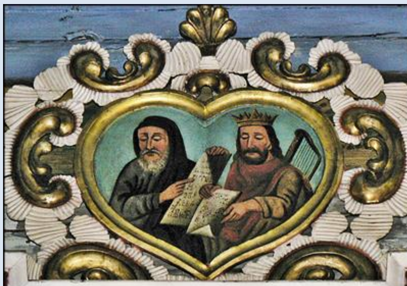
D5,23- Leluchów, MAŁ, ob. w ko paraf. 9b.cer. św. Dymitra)