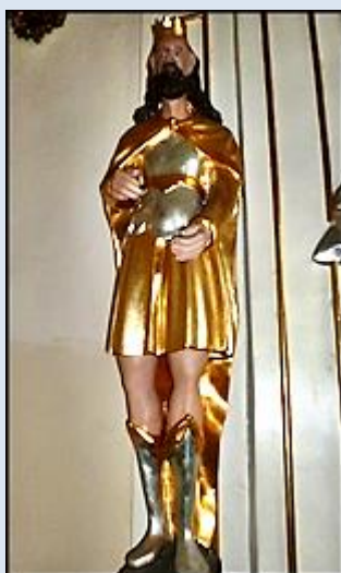
15. Rzym, fg w baz. S. Maria Maggiore; P2070174- 10.IX.'13.