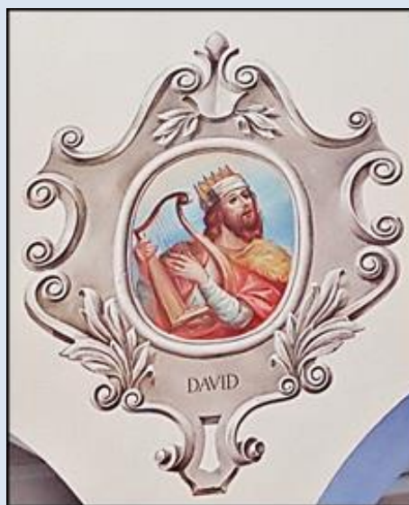
D5,27- Grzybno, KPM, ob. w ko św. Michała Arch. Gliwice-Ostropa, ko. Ducha Świętego (zdz. pw)