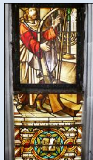
16. Tuchów, MAŁ, fg w ko św. Jakuba Ap.