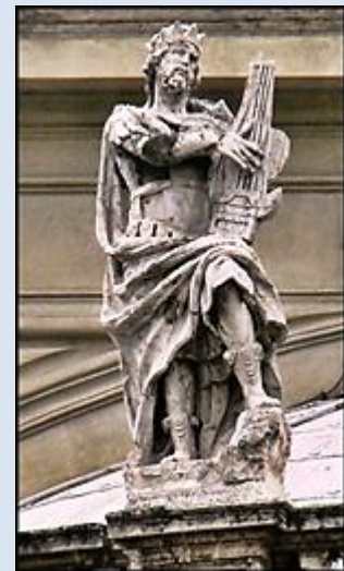
13. Łowicz, fg w ko MB Łaskawej (Pijarów);