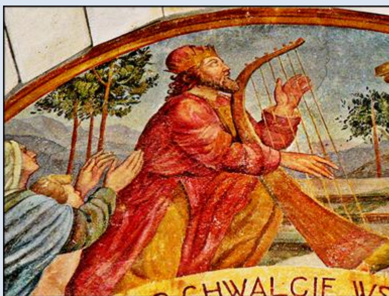
D5,22- Szaflary, MAŁ, fk w ko św. Andrzeja;