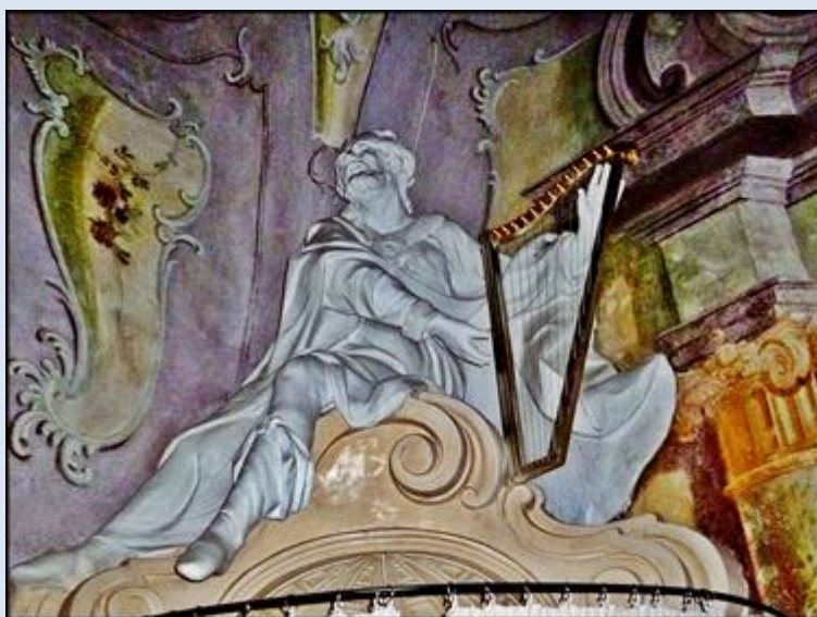
D5,21- Głogówek, fg w ko św. Bartłomieja;