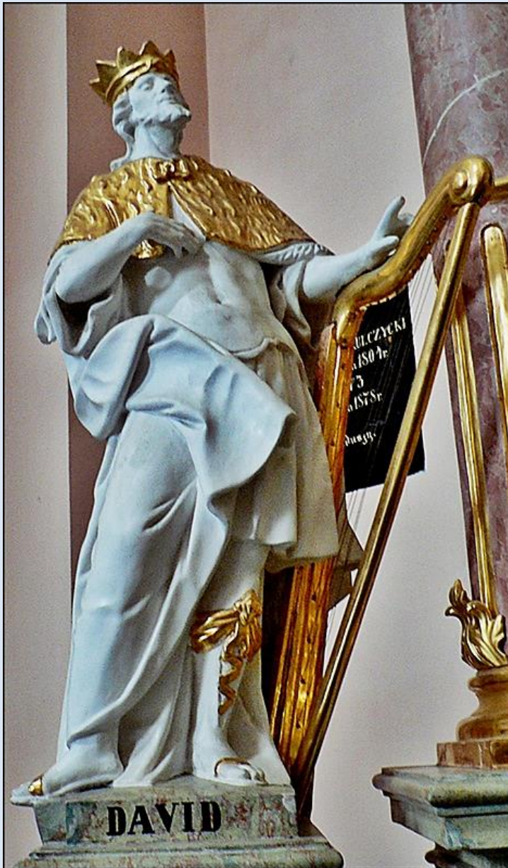
Miechów, fg w Bazylice Grobu Pańskiego

zobacz: Święci w Polsce i ich kult w świetle historii http://sancti-in-polonia.wietrzykowski.net/2j.html http://sancti-in-polonia.wietrzykowski.net/7j.html