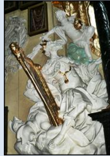
10. Rzym, fg w baz. śś. Ambrożego i Karola Boromeusza; P1770700- 25.III.'12.