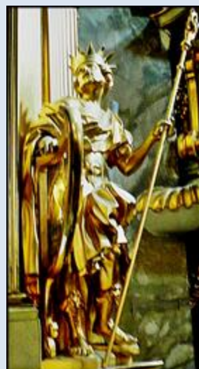
D5,24- Warszawa, fg w Muzeum Narodowym; D5,25- Święta Lipka, fg w baz. Nawiedzenia NMP; D5,26- Kielce, fg w baz. NMP;