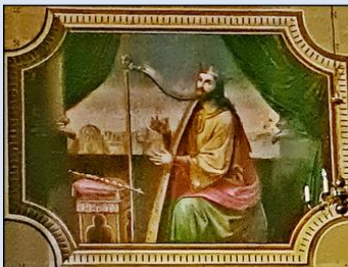
Góra, ko. WNMP Sławków, przed ko. Podwyższenia Krzyża Świętego i św. Mikołaja