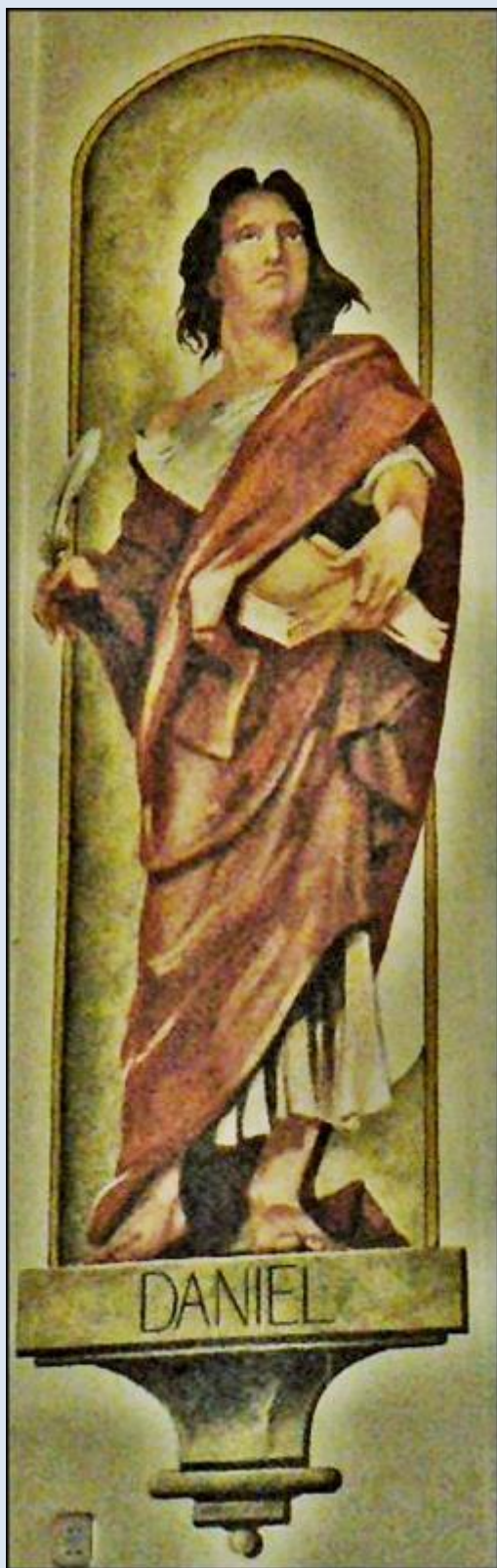
Mikołów, fk w baz. św. Wojciecha