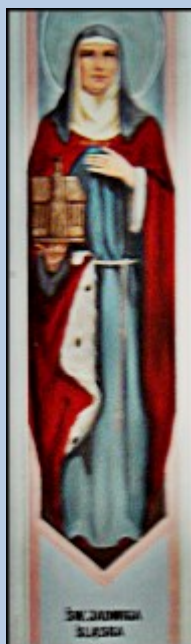
ŚW. JADWIGA KRAKOWSKA