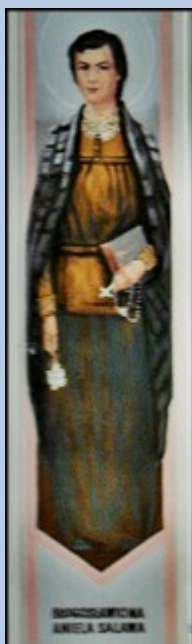
ŚW. JUDYTA ANIEŁA SALOMIA