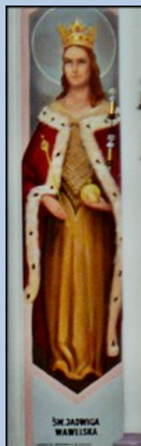
ŚW. JADWIGA WAWELSKA