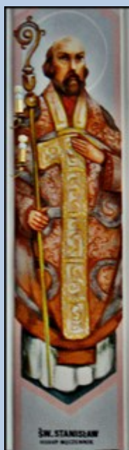
ŚW. STANISŁAW BISKUP WARSZAWSKI