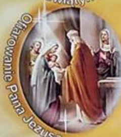
Ofiarowanie Pana Jezusa