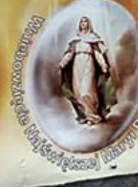
Wniebowzięcie Najświętszej Maryi Panny