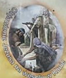
Objawienie Jezusa na weselu w Kanie