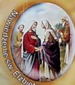
Nawiedzenie Sw. Elzbiety