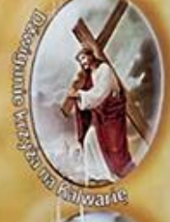
Przebiegnięcie krzyża na Kalwarię