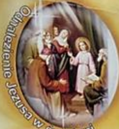
Objawienie Jezusa w świątyni