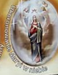
Wniebowzięcie Maryi w niebo