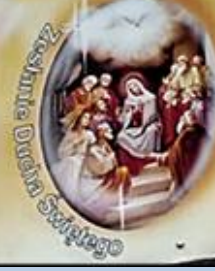
Zesłanie Ducha Świętego