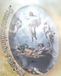
Wniebowstąpienie Pana Jezusa