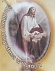
Spuszczenie Chrystusa w Ogrocie