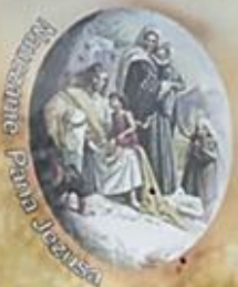
Objawienie Pana Jezusa