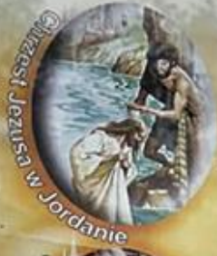
Chrzest Jezusa w Jordanie