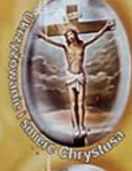
Przeżyłowanie i śmierć Chrystusa