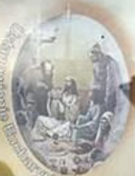
Objawienie w Eucharystii