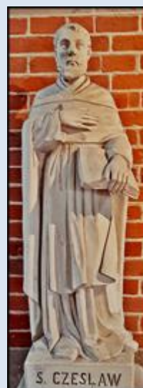
Piekary Śląskie, ko. Świętej Trójcy (zdz. pw) Ruda Śląska-Kochłowice, ko. Trójcy Świętej (zdz. pw) Sandomierz, ko. św. Jakuba Apostoła (zdz. pw)