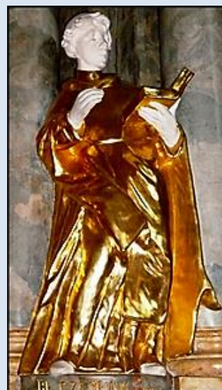
8. Wrocław, rel. w ko św. Wojciecha; 10. Częstochowa, fg w ko św. Zygmunta;