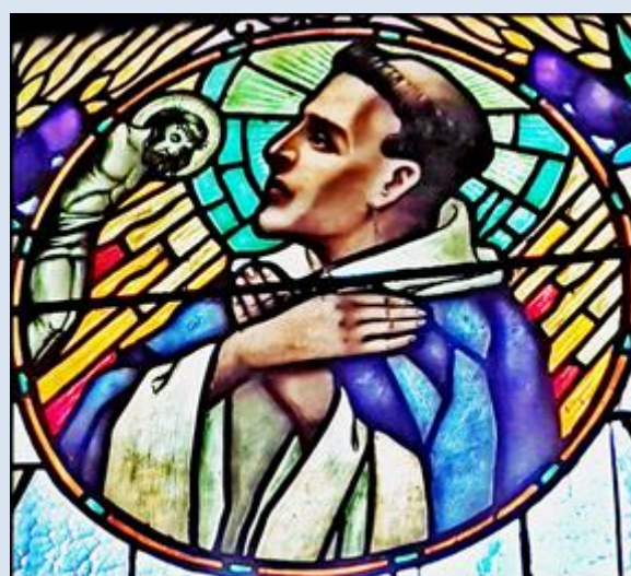
C2,25- Racibórz, fk w ko WNMP; Siemianowice Śląskie, ko. św. Antoniego (zdz. pw)