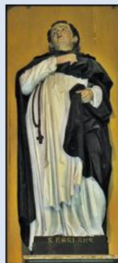
11. Janów Lubelski, LBL, fg w ko św. Jana Chrz.; P1050767- 16.VI.'14. 12. Raczek, PDL, fg w ko paraf. 13. Łódź, fg w ko WNMP; P1760058- 20.II.'12;