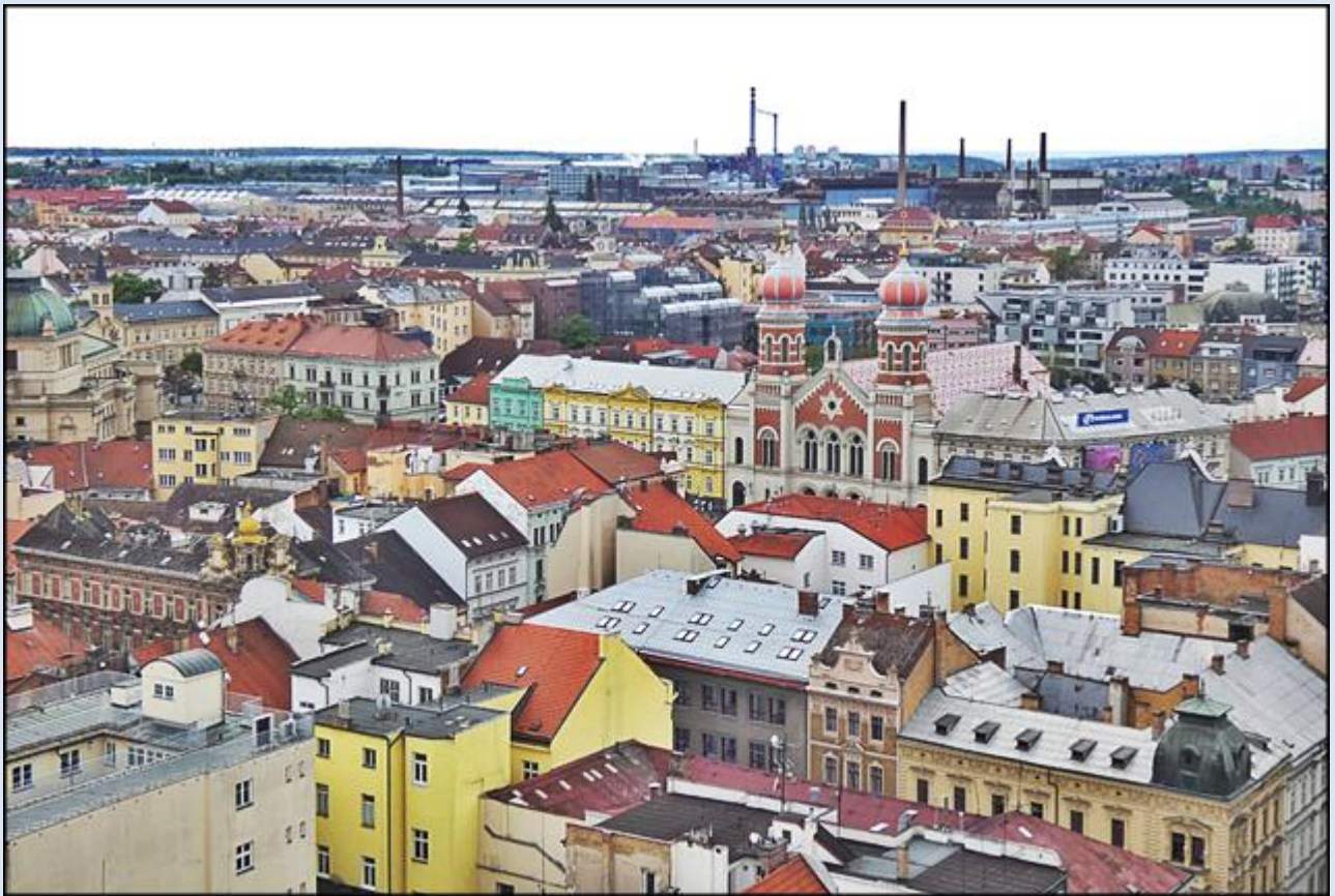
widok z wieży katedry. Na wprost: Wielka Synagoga