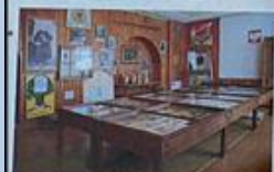
Izba pamięci w Szkole Podstawowej w Czarnicy