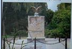
Pomnik w parku-arboretum, wzniesiony w 1966 r. w 100-lecie trójsetnej rocznicy państwa polskiego