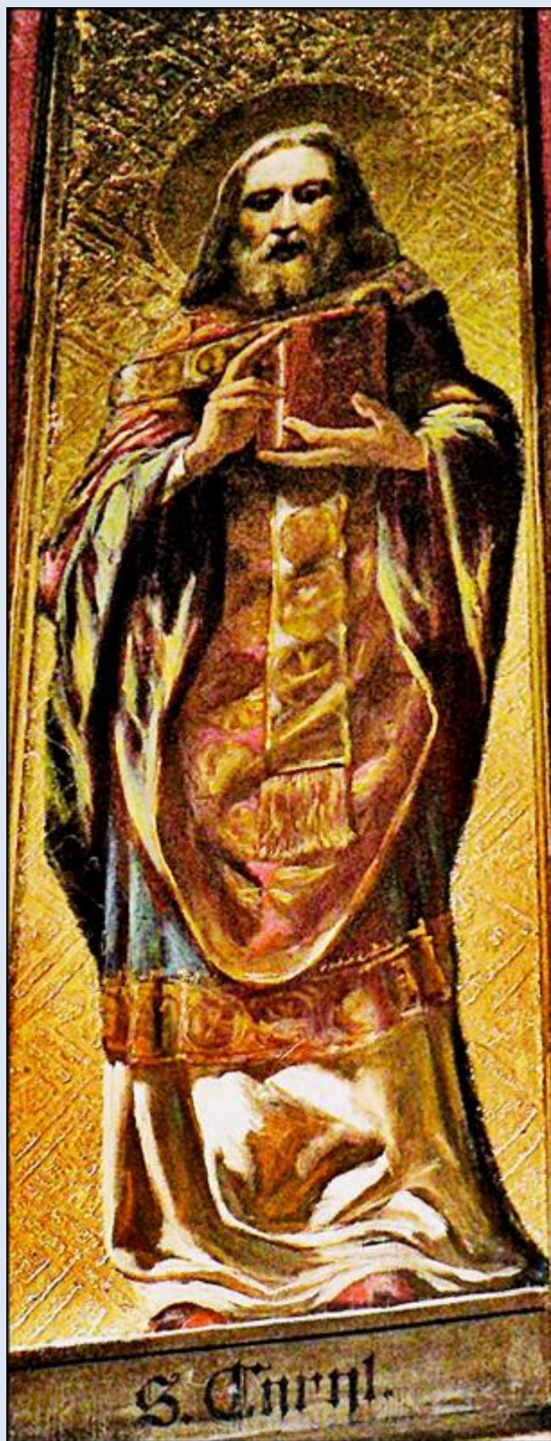
Kraków, Kościół pw. św. Katarzyny

zob. Święci w Polsce i ich kult w świetle historii http://sancti-in-polonia.wietrzykowski.net/2c.html http://sancti-in-polonia.wietrzykowski.net/7c.html