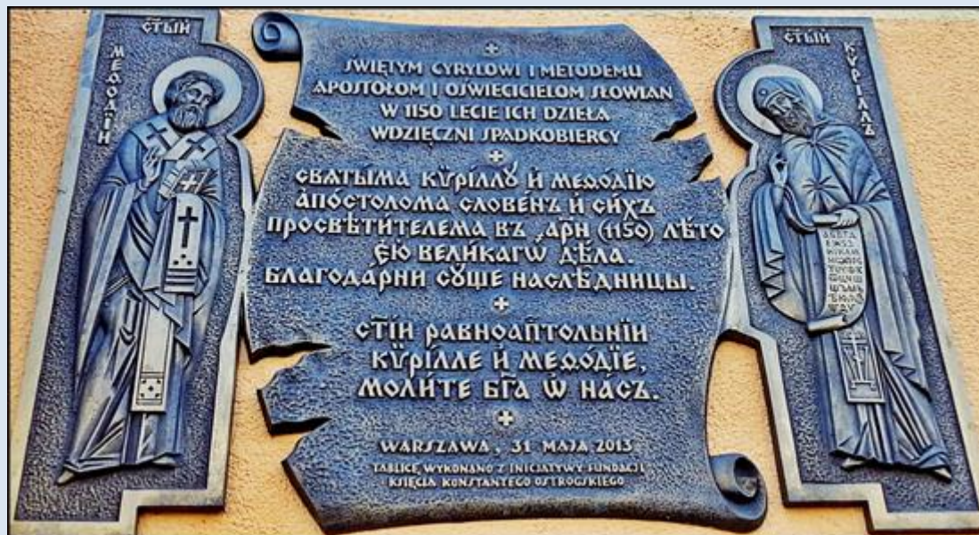
Warszawa, Cerkiew prawosławna