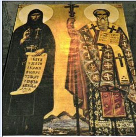
Saints Cyrille et Méthode