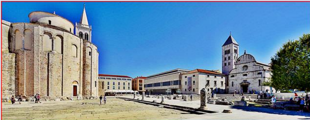
z lewej: Kościół pw. św. Donata, za nim: Katedra pw. św. Anastazji, z prawej: Kościół pw. Matki Bożej