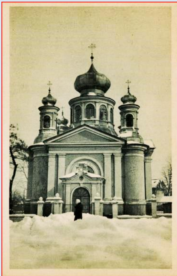
Cerkiew w 1919 r,