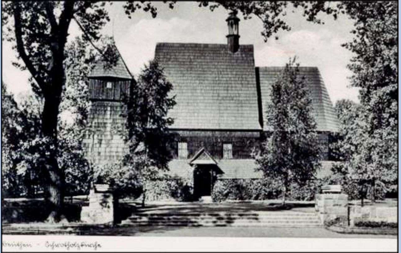
Königsau - Eiferwäldchirche