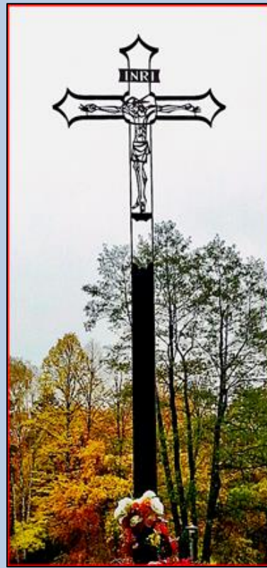
krzyż na miejscu spalonego kościoła