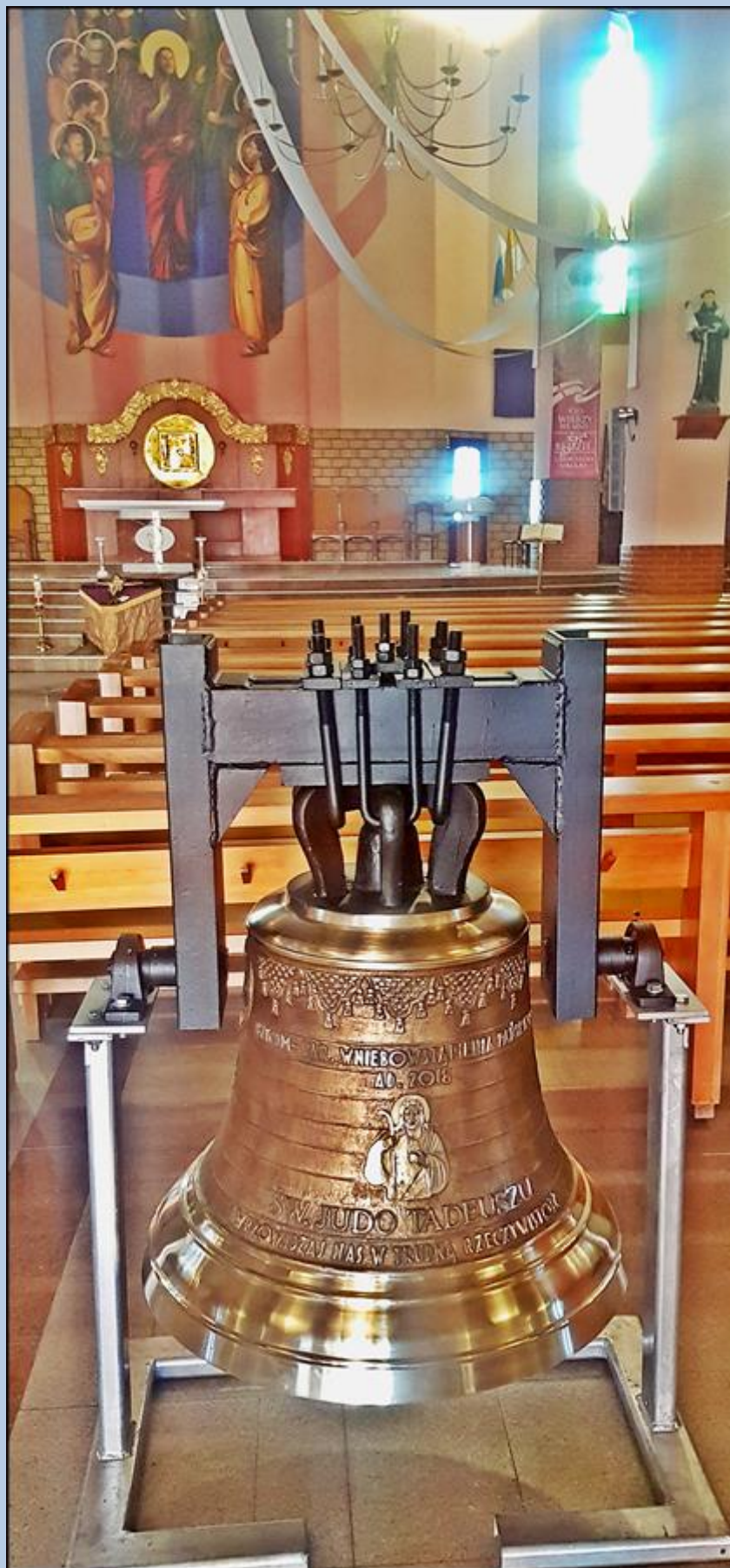
Uzupełnienie pw z dnia 20.04.2019