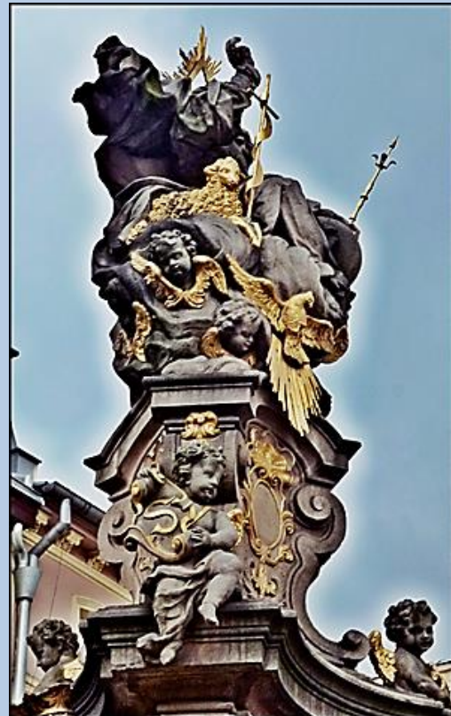
Trójca: Bóg Ojciec, Syn Boży – Baranek, Duch Święty - Gołębica