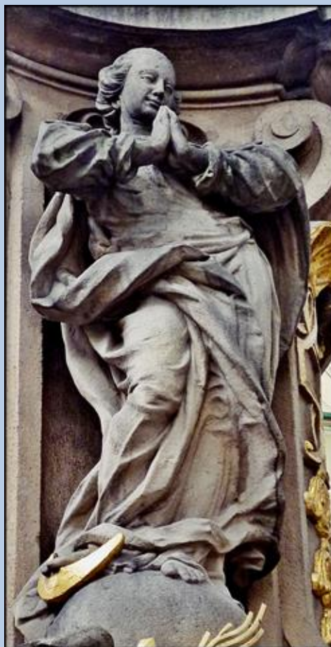
św. Joachim i Maryja – Matka Boża