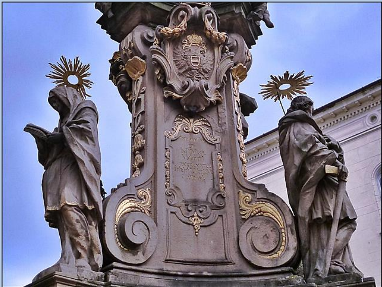
św. Anna i św. Józef