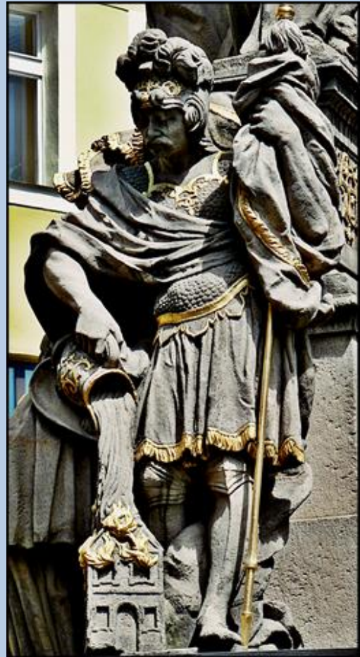
św. Michał Anioł - św. Florian