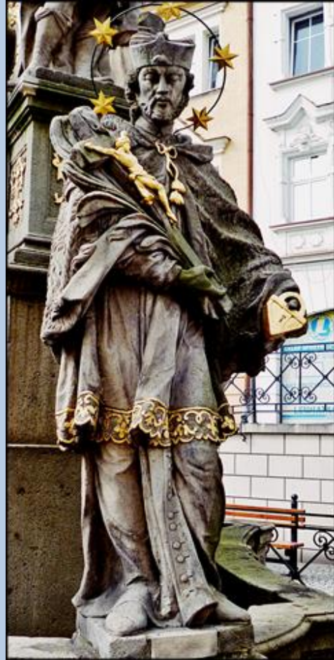
św. Franciszek Ksawery – św. Jan Nepomucen