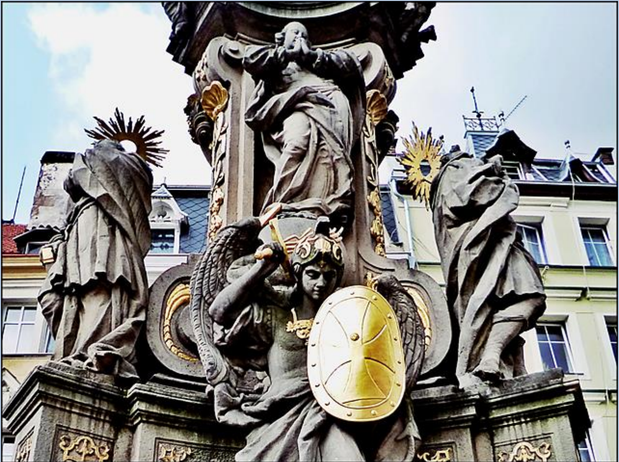
Matka Boża – Maryja; po lewej – św. Józef, po prawej – św. Anna; przed nią – św. Michał Anioł