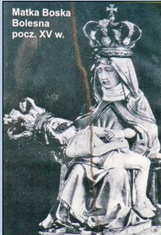
Matka Boska Bolesna pocz. XV w.

O Matko Pocieszycielko, pocieszaj nas wszystkich i spraw, aby wszyscy zrozumieli, że tajemnica szczęścia znajduje się w dobroci oraz w stałym i wiernym naśladowaniu Twego Syna Jezusa!