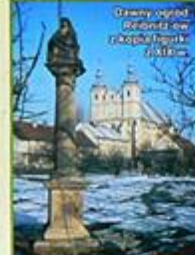
Dawny wygląd figurki w polskiej figurze z 1447 r.