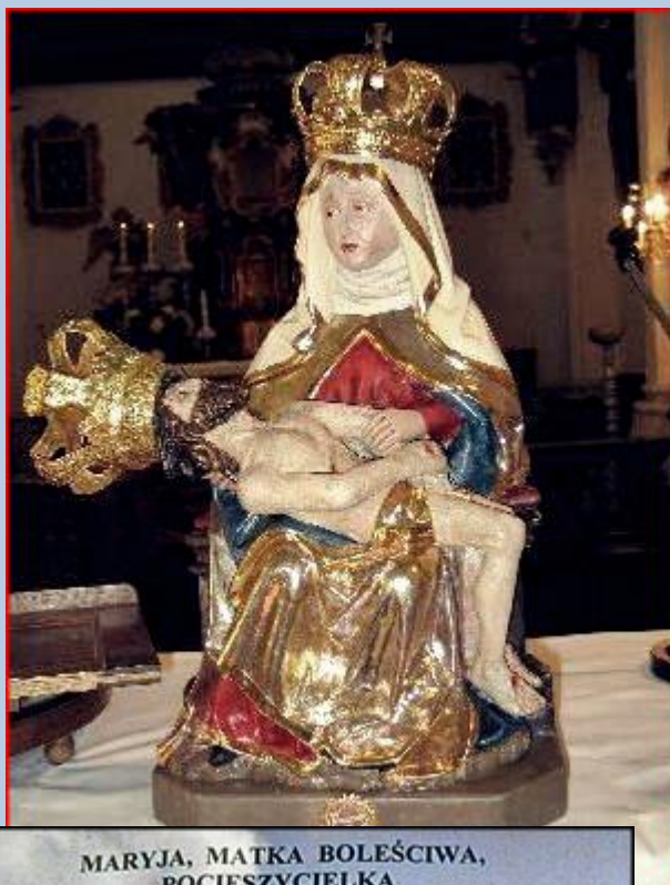
MARYJA, MATKA BOLEŚCIWA, POCIESZYCIELKA

Najświętsza Maryja Panna jest Pocieszycielką w tak licznych boleściach fizycznych i moralnych, które gnębią i dręczą ludzkość. Ona zna nasze bóle i nasze utrapienia, ponieważ Ona również cierpiała od Betlejem po Kalwarię: „A Twoją duszę miecz przeniknie”. Maryja jest naszą Matką duchową, a matka zawsze rozumie swoje dzieci i pociesza je w ich smutkach.