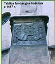
Tablica fundacyjna kościoła z 1447 r.