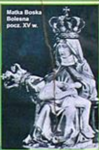
Matka Boska Bolesna pocz. XV w.