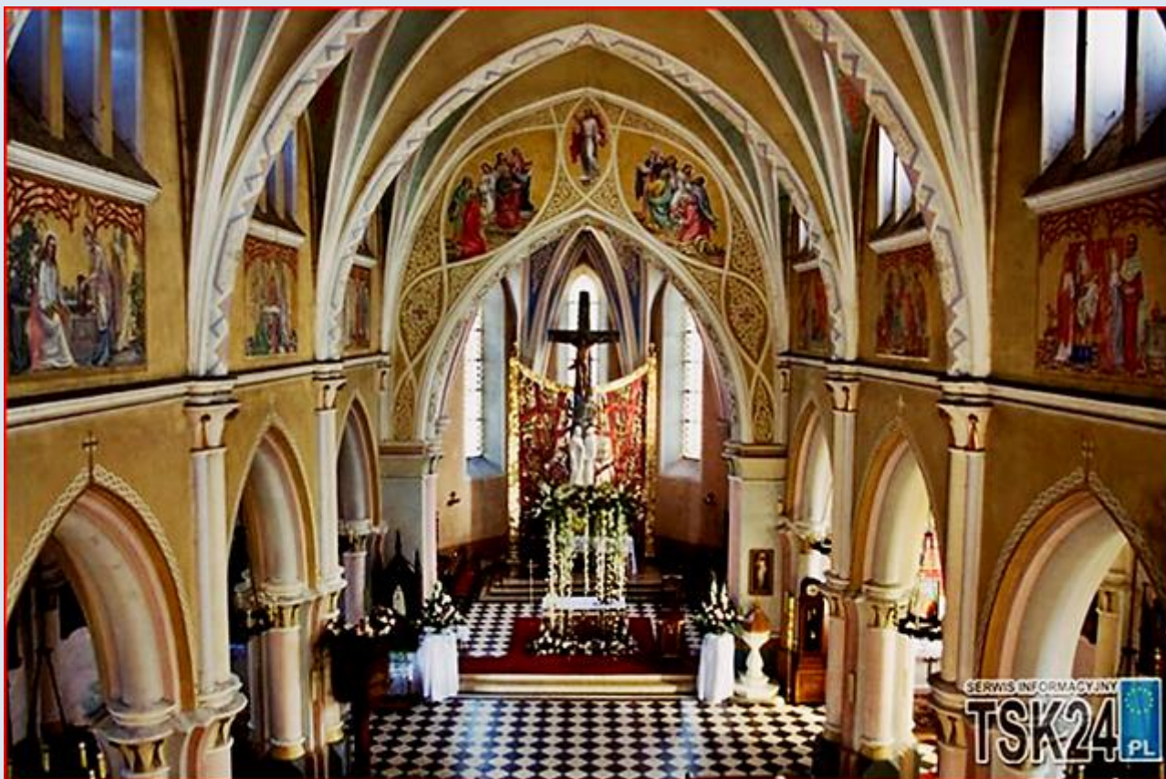
Kościół pw. św. Ludwika