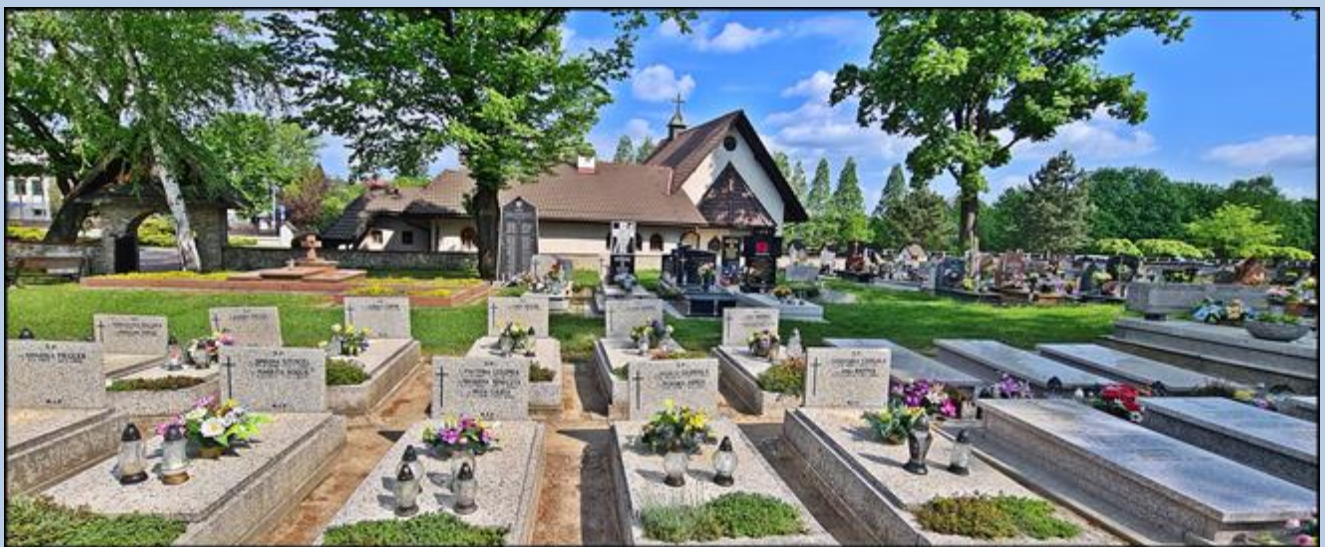
Groby Sióstr Zakonnych