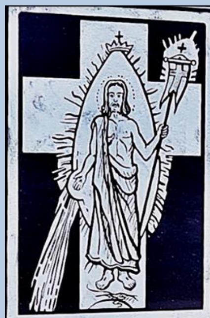
Pomnik 'Pamięci Ślązaków'