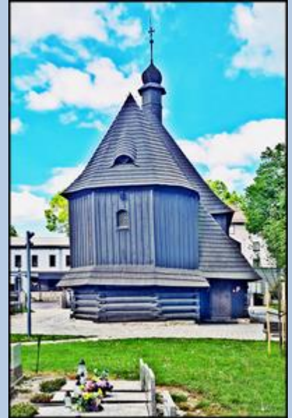
Pomnik św. Walentego naprzeciw jego Sanktuarium