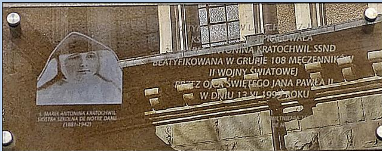
bł. S. Maria Antonina Kratochwil