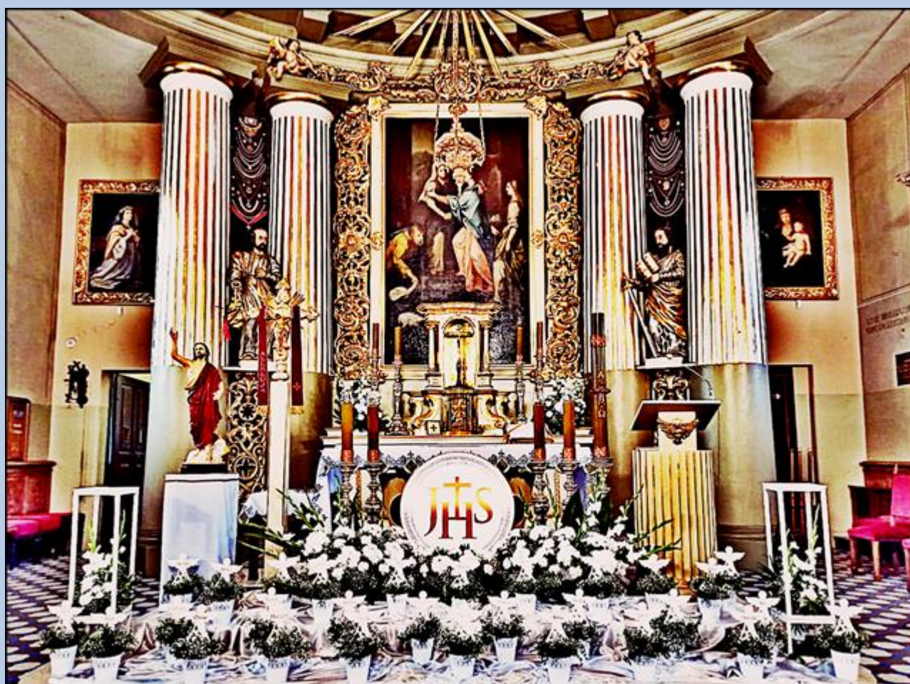
i piękny wystrój komunijny 27.05.2023 r.