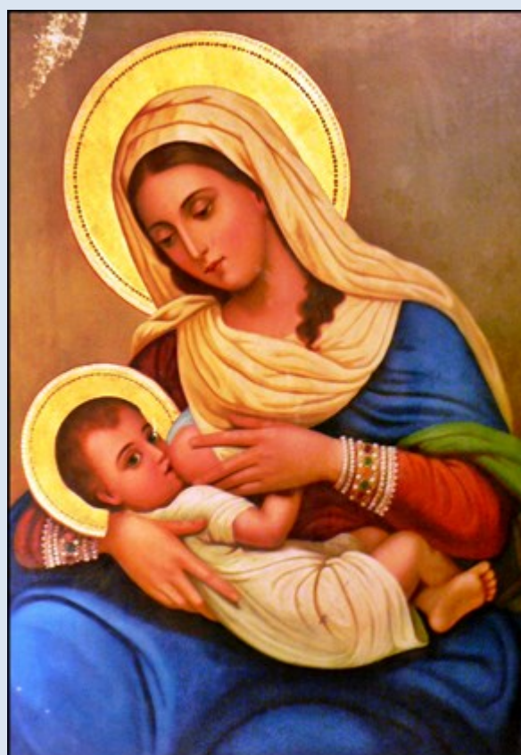
Betlejem żegna graffiti na murach z życzeniem wolności i pokoju – i obrazem Matki Boskiej Dostatku z Groty Mlecznej