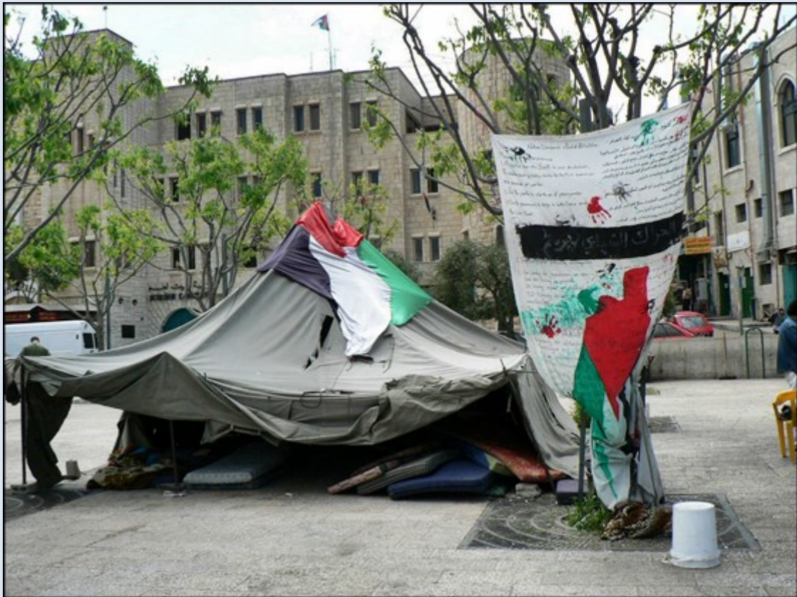
W samym Betlejem – namiot protestacyjny