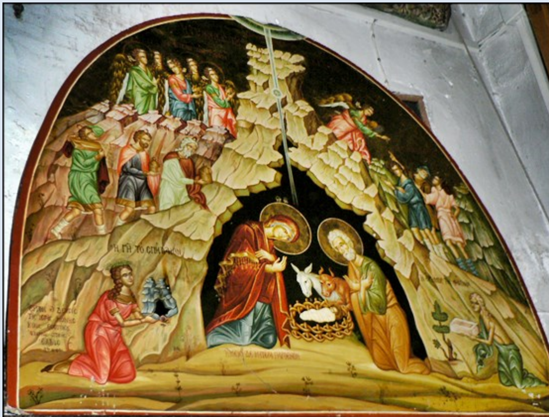
i także motyw na obrazie...