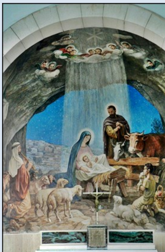
Wnętrze kościoła Pola Pasterzy – ołtarz w tej świątyni