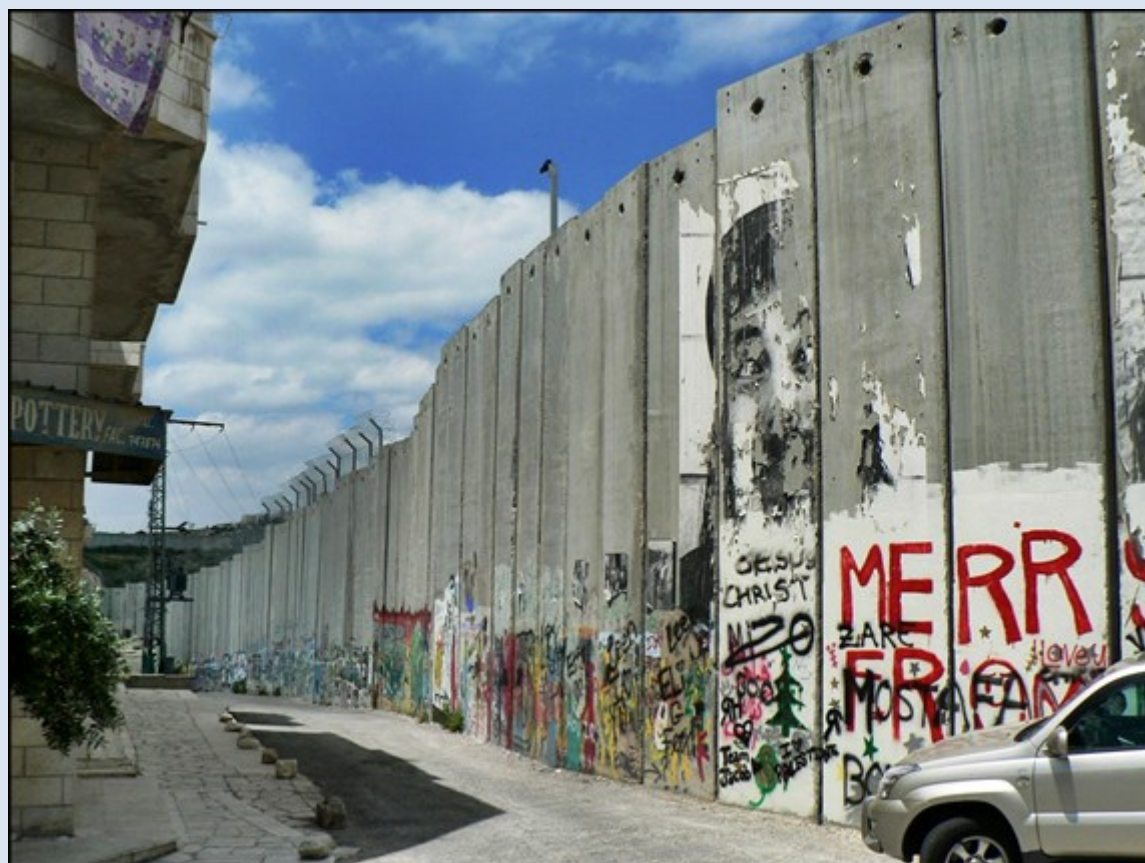
Mury – cd.