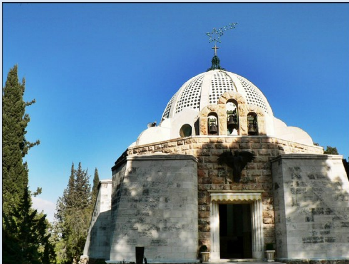
Kościół na Polu Pasterzy