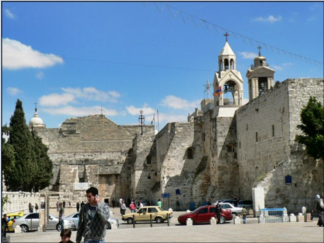
Dotarliśmy do Bazyliki Narodzenia