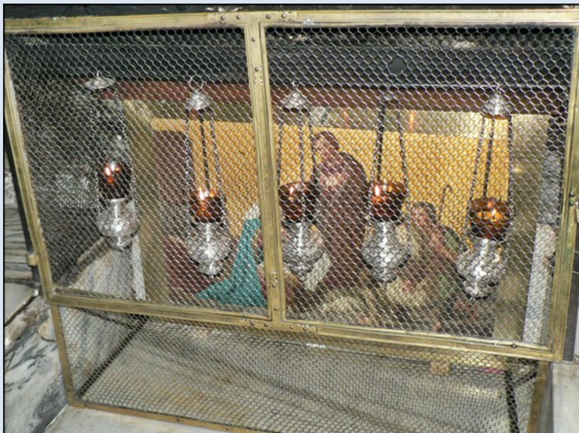
Miejsce Narodzenia ...