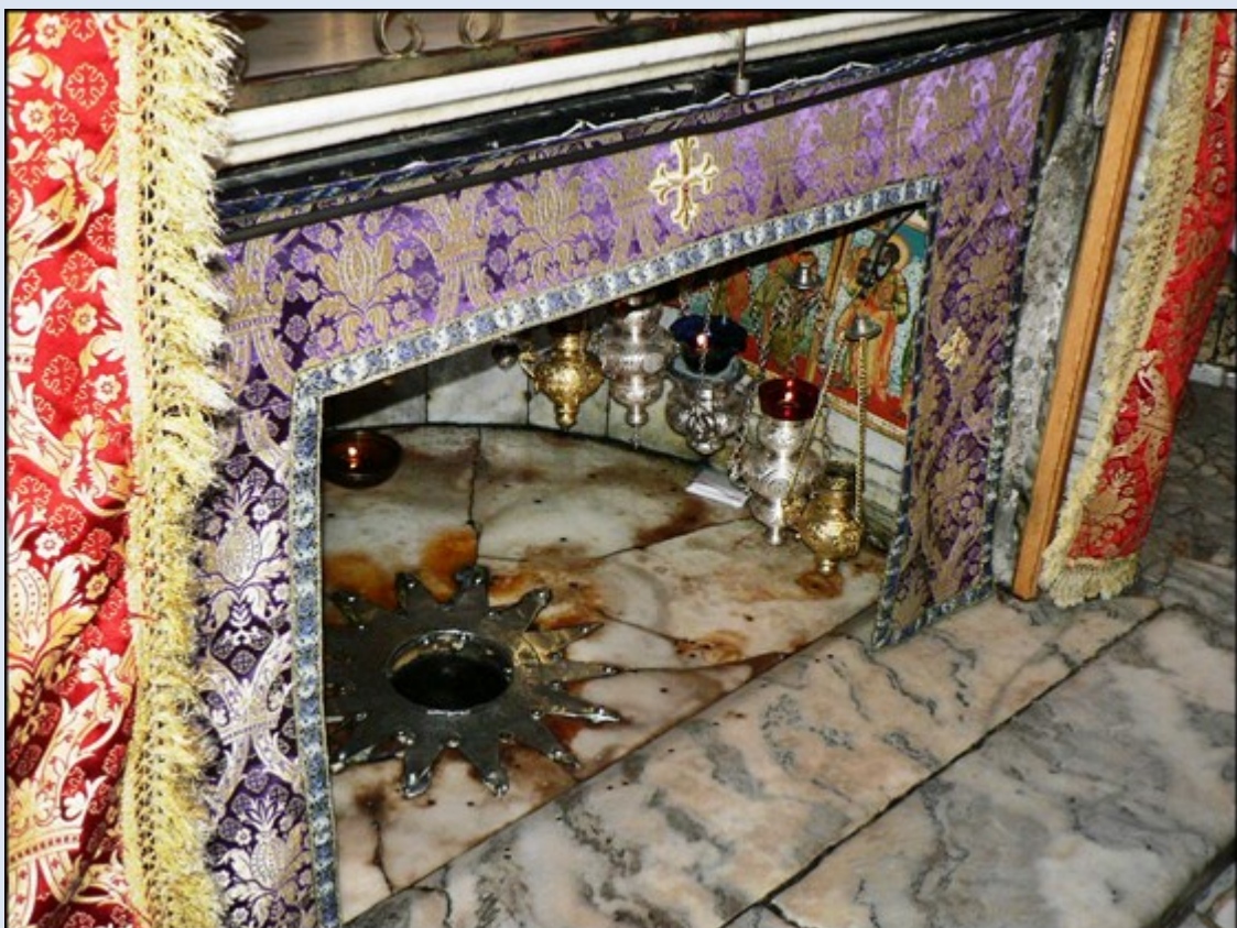
a w niej Miejsce Narodzenia