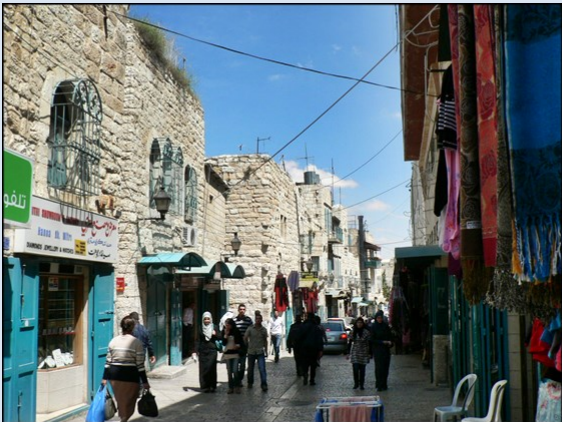
ale ulice Betlejem bezpieczne...