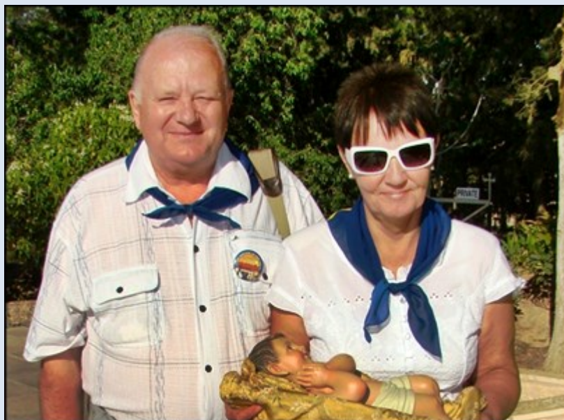
Autor opisu i zdjęć wraz z małżonką jako asysta do Mszy świętej