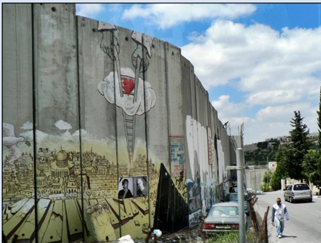
Mury odgradzające Betlejem od państwa Izrael