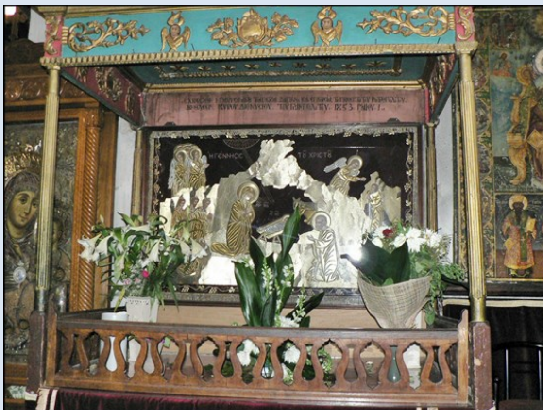
Motyw Narodzenia w Bazylice