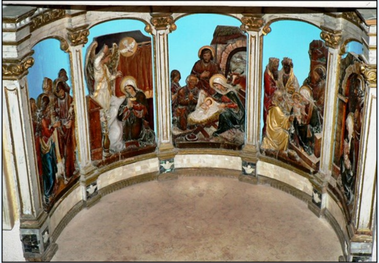
w Grocie Mlecznej