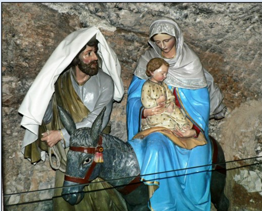
W Grocie Mlecznej