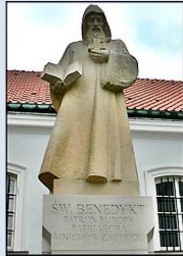
ŚW. BENEDYKT PATRON BISKUPÓW PATRIARCHA KONWENTU ZACZYŃCÓW

1. Rzym, fg w baz. św. Pawła za Murami; P1780749- 27.III.'12.