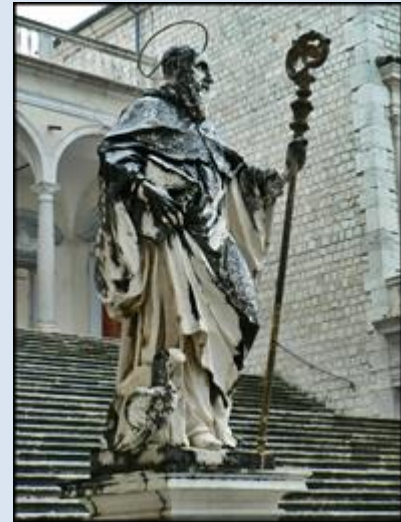
11. Włochy – Monte Cassino, fg przydrodze do klasztoru; P2060680- 9.IX.'13.