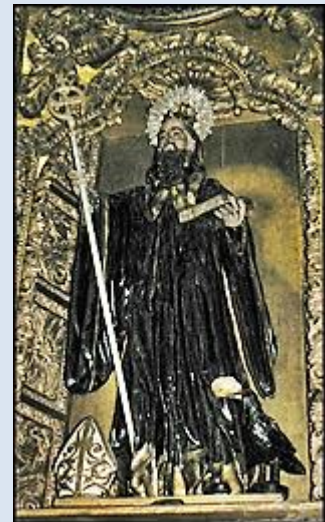
22. Wigry, ob. 2 Niepokalanego Poczęcia NMP; 23. Warszawa, wt w ko Niepokalanego Poczęcia NMP; 24. Koprzywnica, ŚWK, fg w ko św. Floriana; 25. Mogilno, KPM, ob. w ko klaszt. oo. Benedykt.;