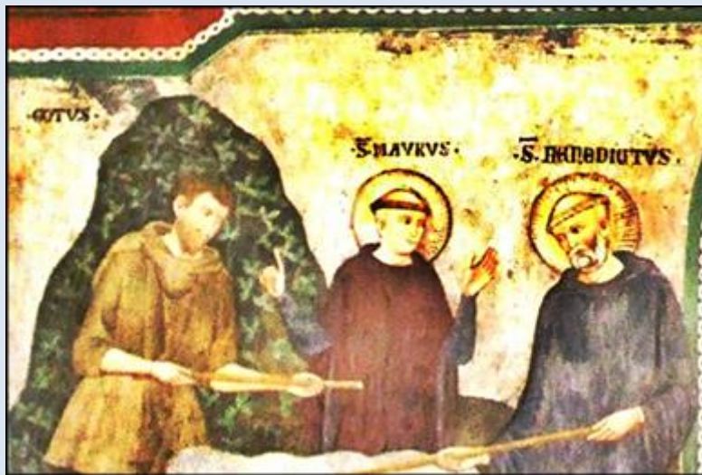
Włochy, Monte Olivetto Maggiore, Opactwo Benedyktynów (zdz. tsw) Włochy, Subiaco, Klasztor św. Benedykta (zdz. tsw)