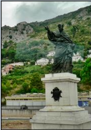
10. Włochy – Asyż, ob. w ko św. Piotra; P2070685- 13.IX.'13.