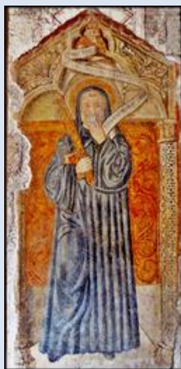
Włochy, Subiaco, klasztor św. Scholastyki