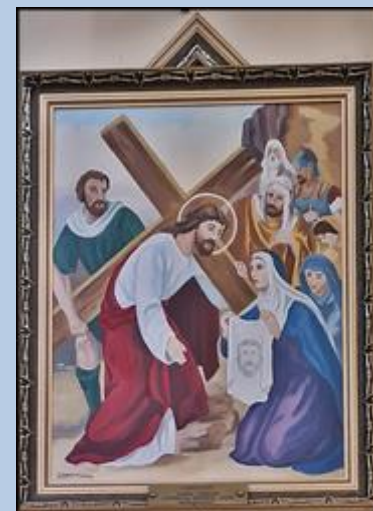
VI WERONIKA OCIERA JEZUSOWI TWARZ