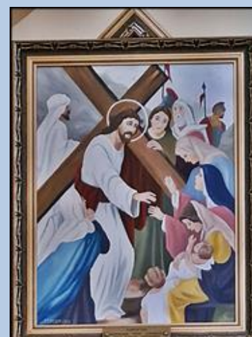
VIII JEZUS POCIESZA PŁACZĄCE NIEWIASTY