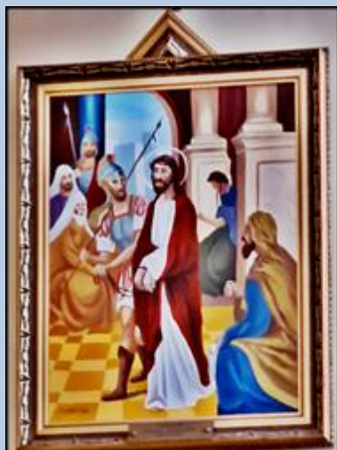
I JEZUS PRZED SĄDEM PILATA