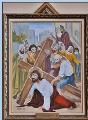
III PIERWSZY UPADEK JEZUSA