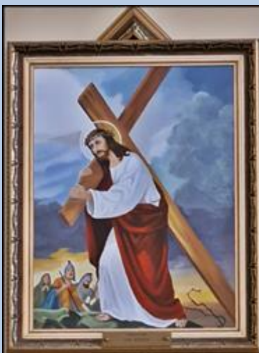
II JEZUS OBARCZONY KRZYŻEM