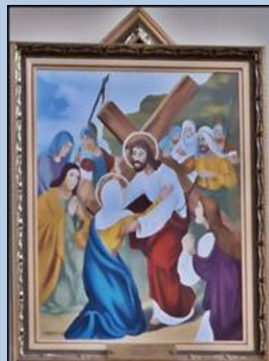
IV SPOTKANIE JEZUSA Z MATKĄ