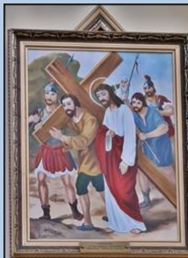
V SZYMON Z CYRENY POMAGA JEZUSOWI