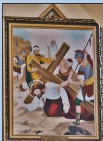
VII DRUGI UPADEK JEZUSA