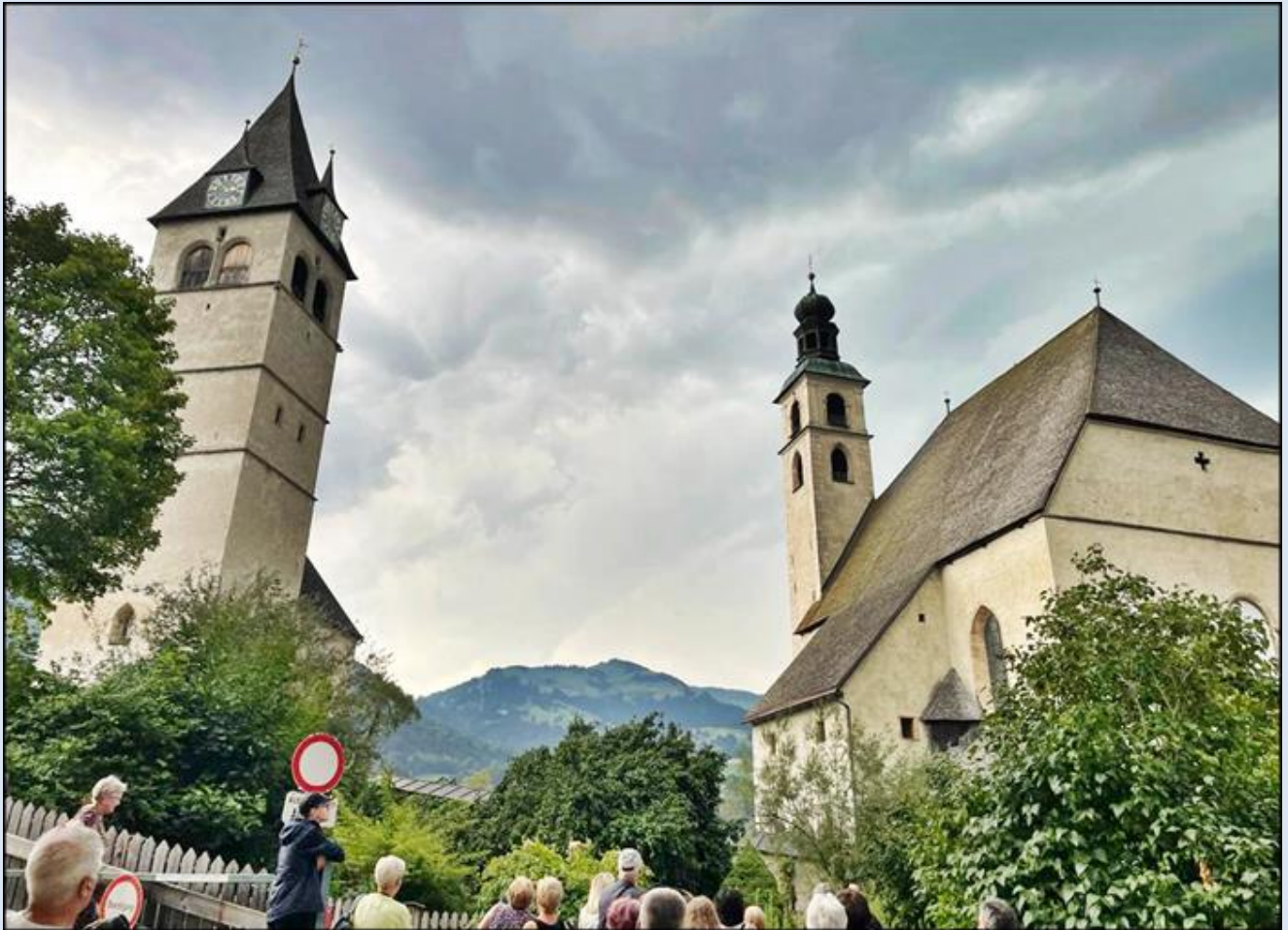
z lewej: Kościół pw. Najświętszej Maryi Panny; z prawej: Kościół św. Andrzeja