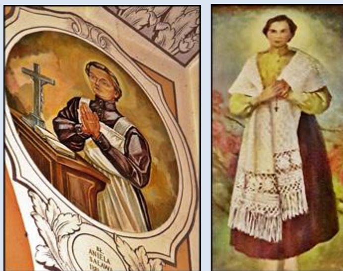
13- Bąkowa Góra, ŁDZ, fk w ko Trójcy Przenajśw. Czeladź, ko. św. Stanisława BM