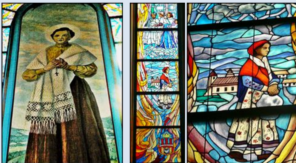
11- Kraków, ob. w ko MB Dobrej Rady; 12- Kraków, wt w ko MB Dobrej Rady;