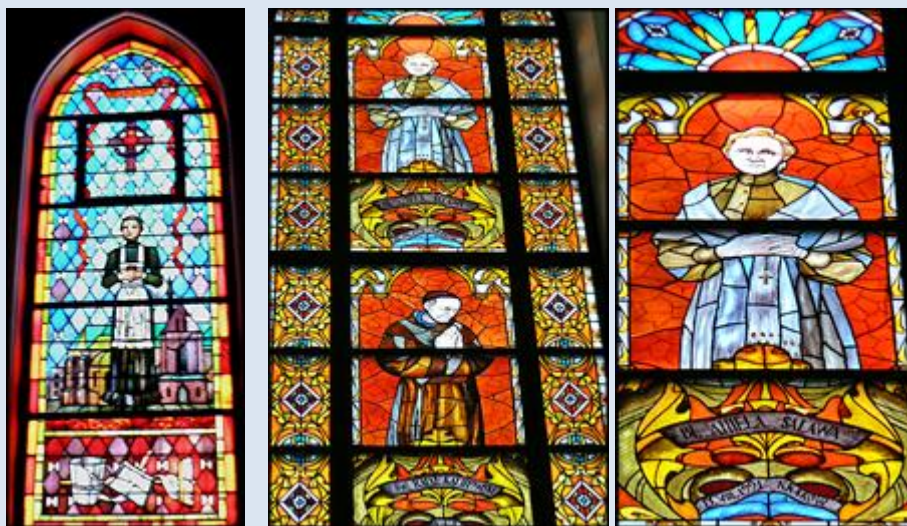
9- Łódź, wt w ko Przemienienia Pańskiego; 10- Warszawa, wt w ko św. Ap. Piotra i Pawła;