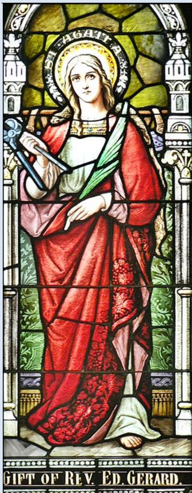
USA – Phoenix, witraż w Katedrze S. Mary's

zobacz: Święci w Polsce i ich kult w świetle historii http://sancti-in-polonia.wietrzykowski.net/2a.html http://sancti-in-polonia.wietrzykowski.net/7a.html