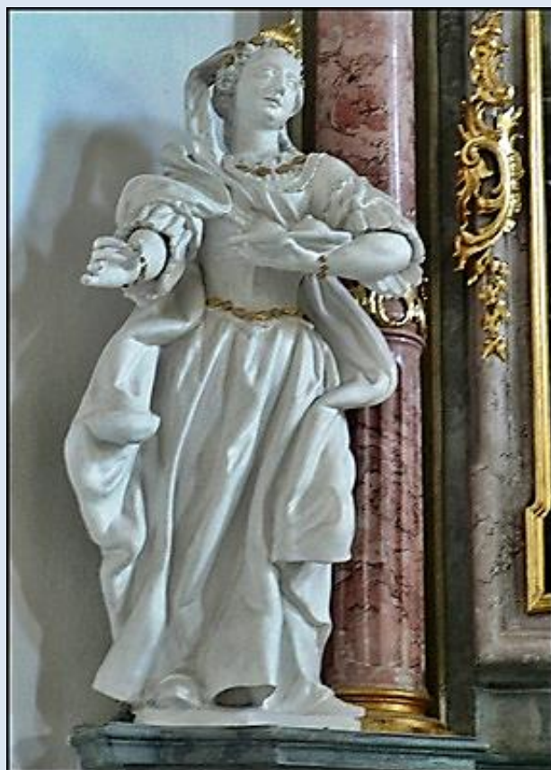
4. Krzeszów, DLN, fg w baz. WNMP,