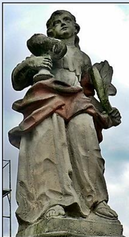
5. Rytwiany fg Pustelnia karm.