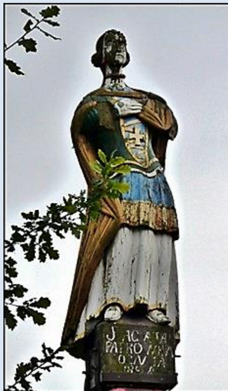
8. Sejny, PDL, fg na kd – skwer k. baz. Nawiedzenia NMP,