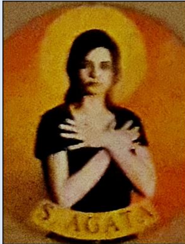
Czeladź, ko. św. Stanisława BM (zdz. pw)