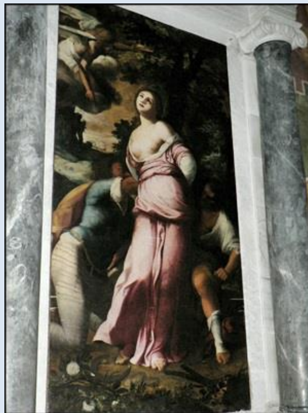
3. Rzym, ob. w baz. Santa Cecylia, P1790950- 29.III.'12.