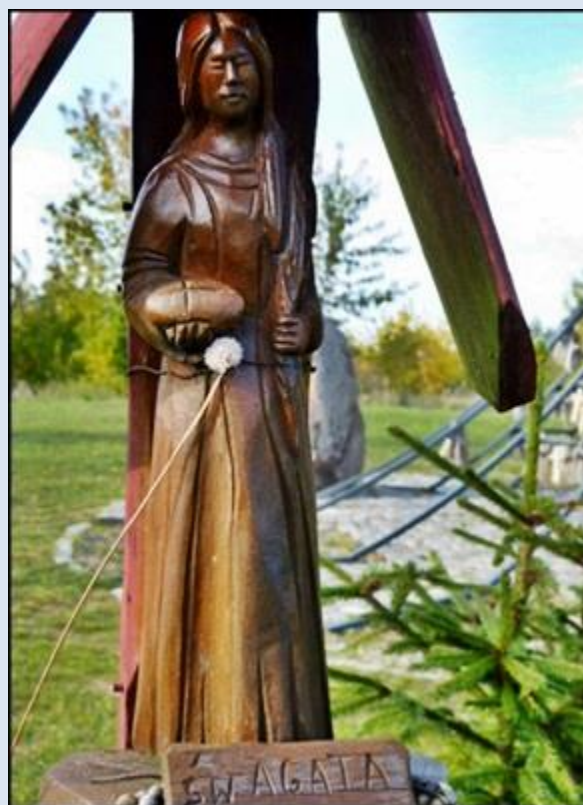
9. Wasilków, PDL, fg drew. na Górze Krzyży- Sankt. Święta Woda