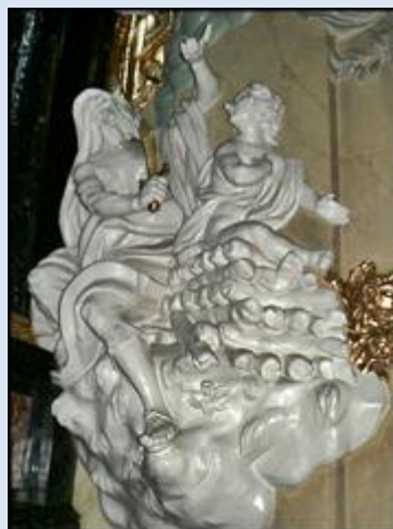
1. Francja – Lourdes, kop. ob. w baz. św. Piusa X, P1850594- 4.VII.'12.