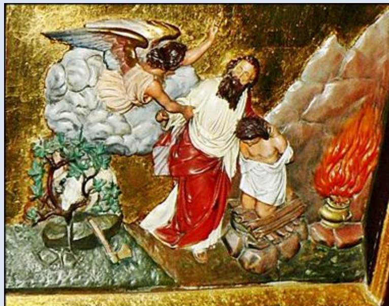
A33,11- Lubliniec, ŚLS, ob. w ko św. Mikołaja BW;