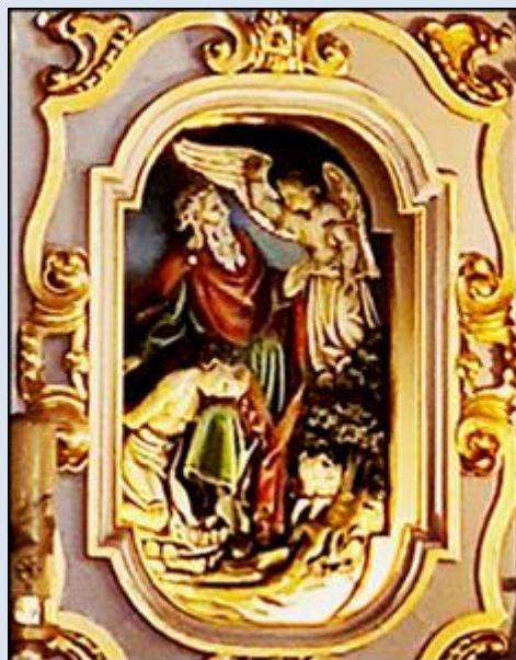
Prudnik, ko. św. Michała Arch. (zdj. pw) Zabrze-Rokitnica, ko. NSPJ (zdj. pw) Tychy, ko. św. Marii Magdaleny (zdj. pw)