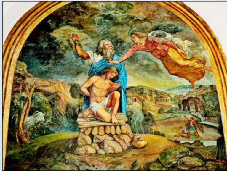
A33,10- Szaflary, MAŁ, ob. w ko św. Andrzeja;