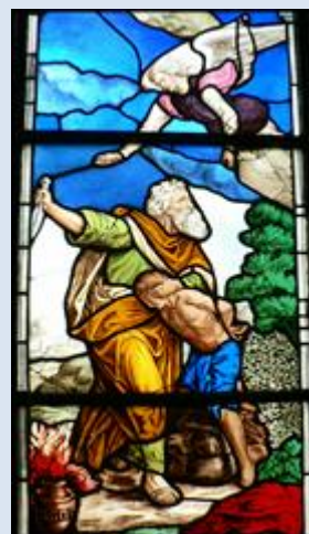
4. Miechów, fg w baz.- Sankt. Grobu Pańskiego,