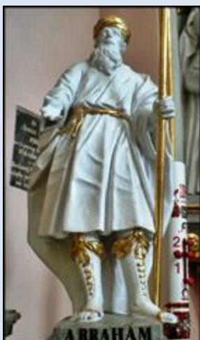
3. Kraków, fg w baz. św. Michała Arch. i św. Stanisława (Na Skalce),