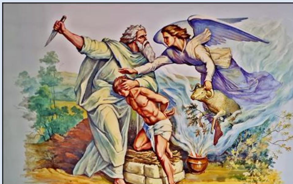
Wolbrom, ko. Podwyższenia Krzyża Świętego