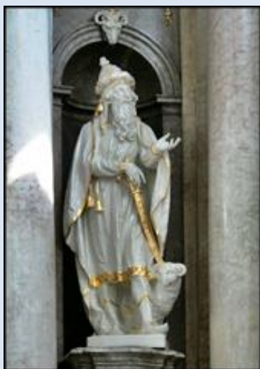
6. Łódź, wt w ko Najśw. Imienia Jezus,