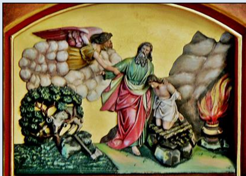
A33,12- Katowice, pł. w baz. św. Szczepana