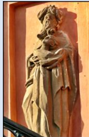
7. Łądek Zdrój, fg w ko Narodzenia NMP,