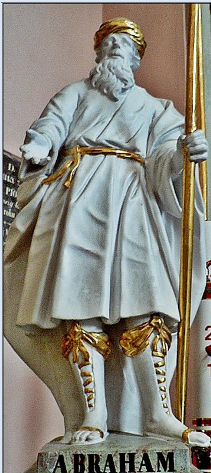
Miechów, fg w Bazylice-Sanktuarium Grobu Pańskiego

https://breviarz.pl/czytelnia/swieci/10-09f.php3