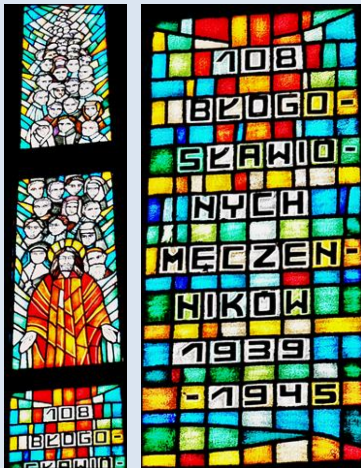
M77,2- Bydgoszcz, wt w ko MB Częstochowskiej

Boże w Trójcy Świętej jedyny, niech będzie uwielbione Twoje święte Imię przez Błogosławionych Męczenników z naszej polskiej ziemi, teraz i na wieki.